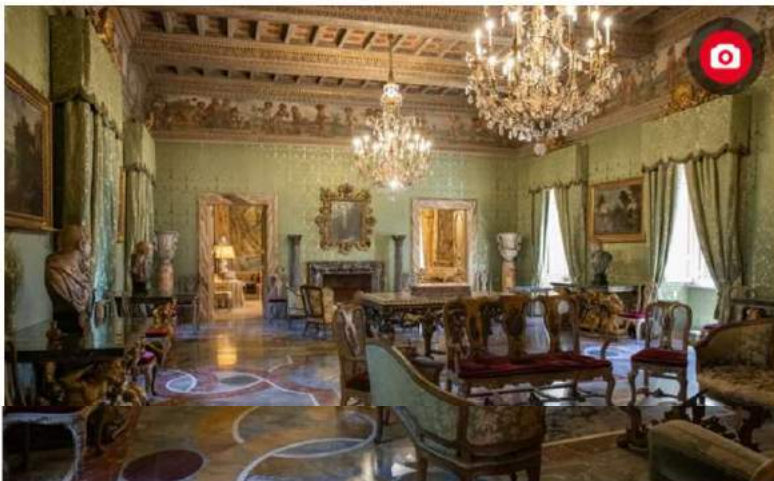
A Casa Litta a Roma torna l'antico splendore - RIPRODUZIONE RISERVATA