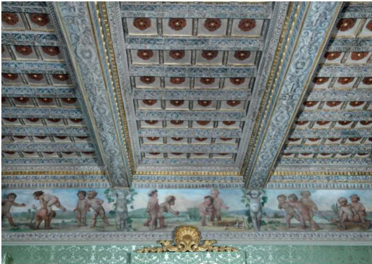
Il soffitto a cassettoni settecentesco e il fascione affrescato di Casa Litta, restaurati grazie al sostegno della Fondazione Sacchetti

L'edificio - che ospita oggi l'Ambasciata dell'Ordine di Malta presso la Santa Sede - sarà nuovamente godibile grazie a un complesso restauro reso possibile grazie al contributo della Fondazione Giulio e Giovanna Sacchetti Onlus.