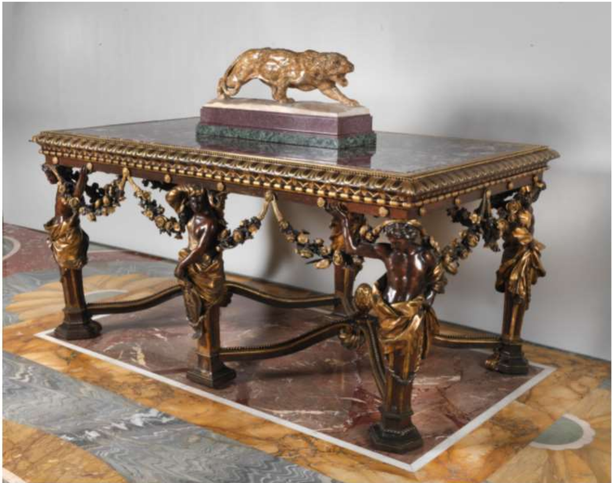
Il Tavolo Borghese realizzato da Alessandro Algardi (1630 circa) su commissione del Cardinale Borghese, completato da Valadier nel 1777, Roma, Casa Litta-Palazzo Orsini, Sala Verde

Anche i putti giocosi del fascione affrescato della Sala Verde, ingrigiti nel tempo dalle infiltrazioni d'acqua piovana, sembrano adesso ammiccare con fulgido cipiglio al "Tavolo Borghese", uno dei migliori esemplari di mobili del barocco italiano giunto fino a noi, capolavoro dell'Algardi, modificato da Valadier, vanto e delizia dell'eccentrico Cardinale collezionista.