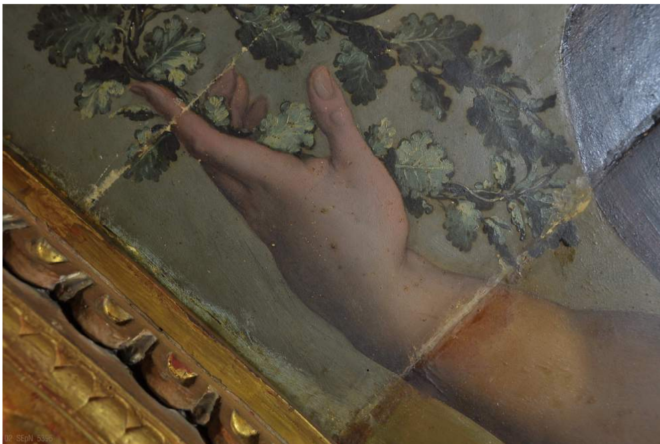
Particolare di una delle prove di pulitura

A partire dal mese di Giugno è stato realizzato il nuovo cantiere con un ponteggio a platea che permetterà la fruizione della sala ed allo stesso tempo l'accesso per le visite guidate che saranno effettuate periodicamente. Sono state eseguite ulteriori prove di pulitura precedute da attente ed accurate indagini preliminari. Visti i buoni risultati ottenuti nelle prove eseguite, si prosegue il lavoro effettuando i consolidamenti nelle pitture del cassettonato.