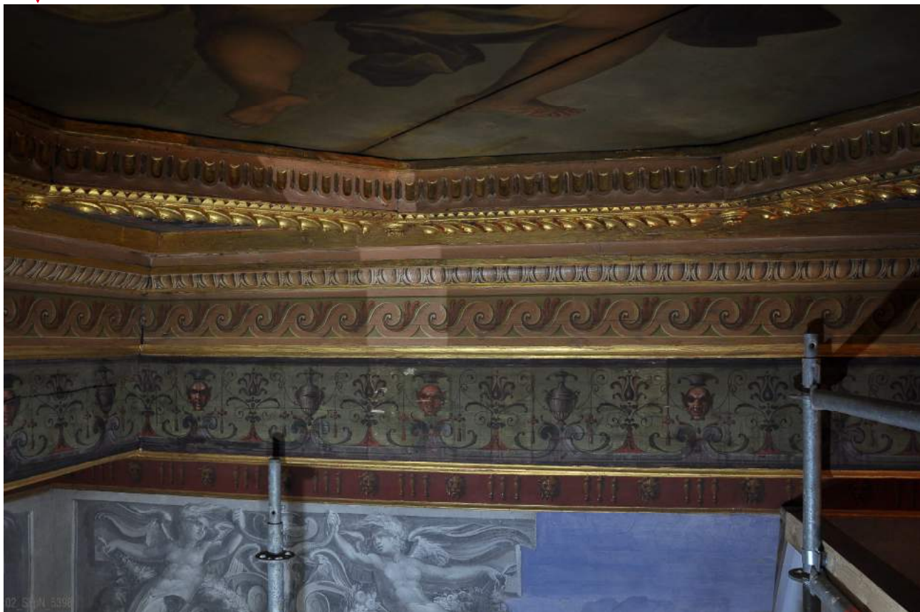
Prove di pulitura sulle cornici

L'ultimazione dei lavori, secondo gli accordi contrattuali, è confermata per il maggio 2019.