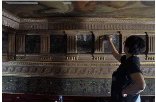
Particolare di cornice prima e durante la fase di restauro