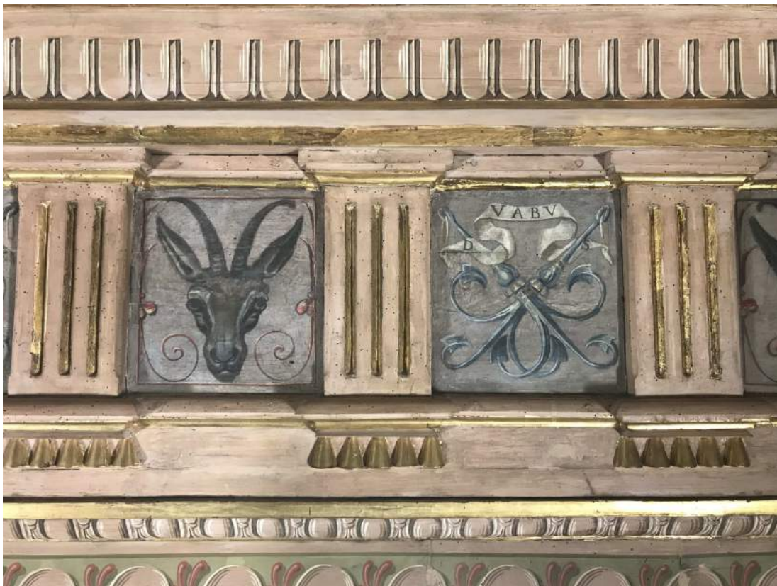
Particolare di cornice dopo la reintegrazione pittorica (fase 4)

Le immagini documentano ancora una volta l'eccezionalità dell'intervento di restauro nell'opportunità offerta di riscoprire il valore cromatico degli apparati originali, mascherati dai trattamenti successivi stratificatisi sulla pellicola pittorica nel corso del tempo, e ripristinarne l'equilibrio con le superfici affrescate sottostante confermando l'importanza della visione della Fondazione oltre le stesse previsioni conservative formulate dall'Ente.