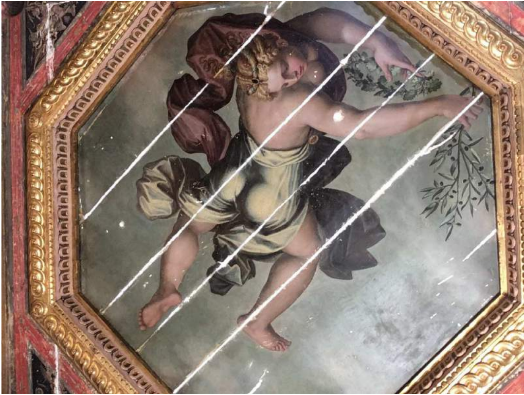
tavola rappresentante "la Pace" dopo la stuccatura (fase 2)