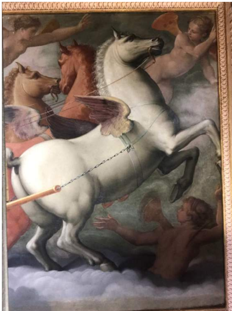
tavola rappresentante "il Carro del Sole" dopo la reintegrazione pittorica (fase 4)