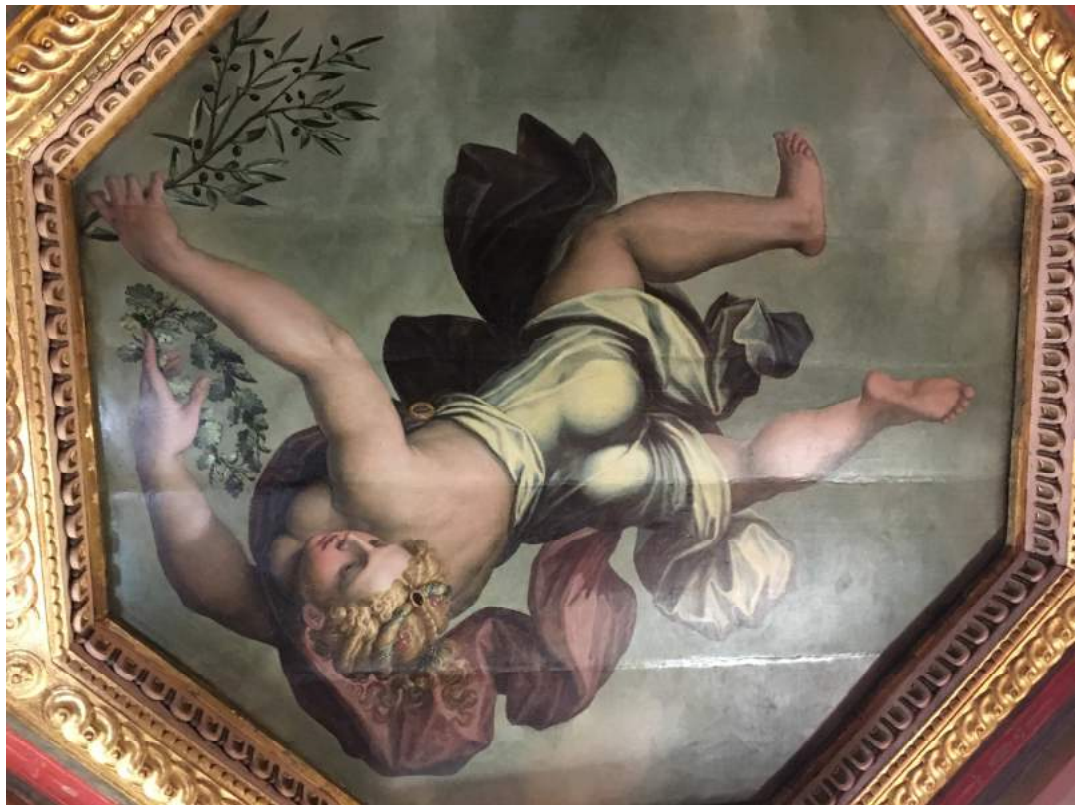
tavola rappresentante "la Pace" dopo la reintegrazione pittorica (fase 4)