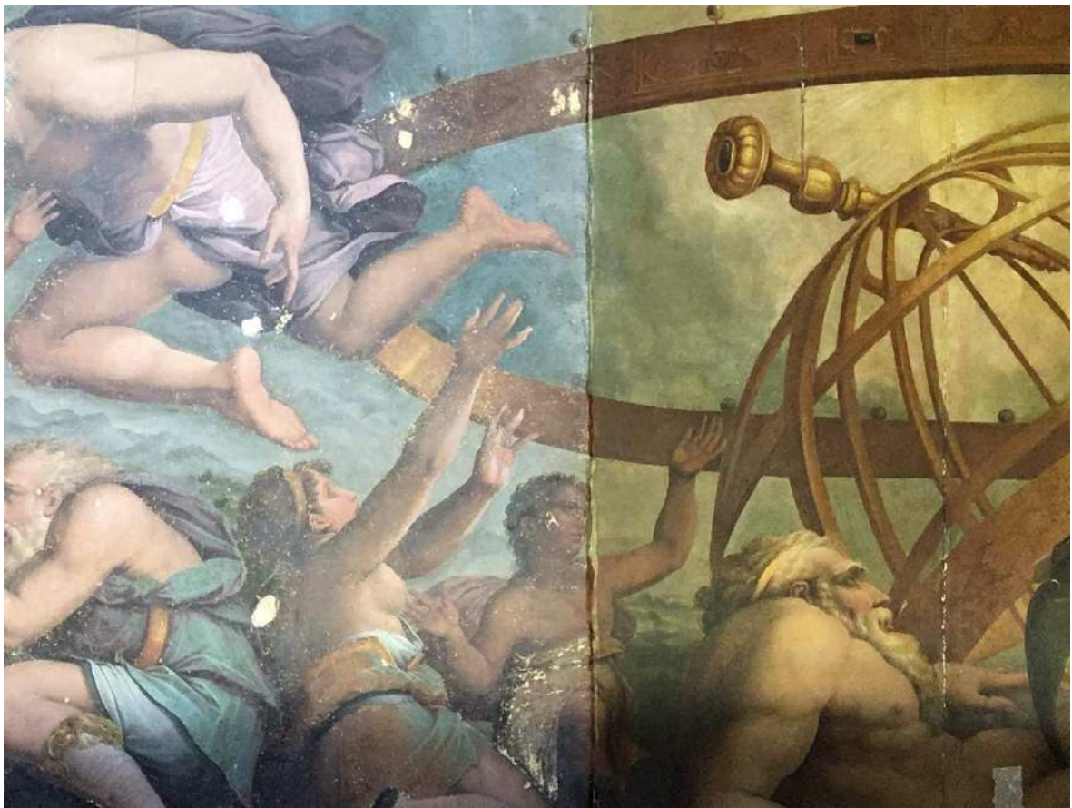
tavola rappresentante "Saturno mutila il Cielo" durante la pulitura