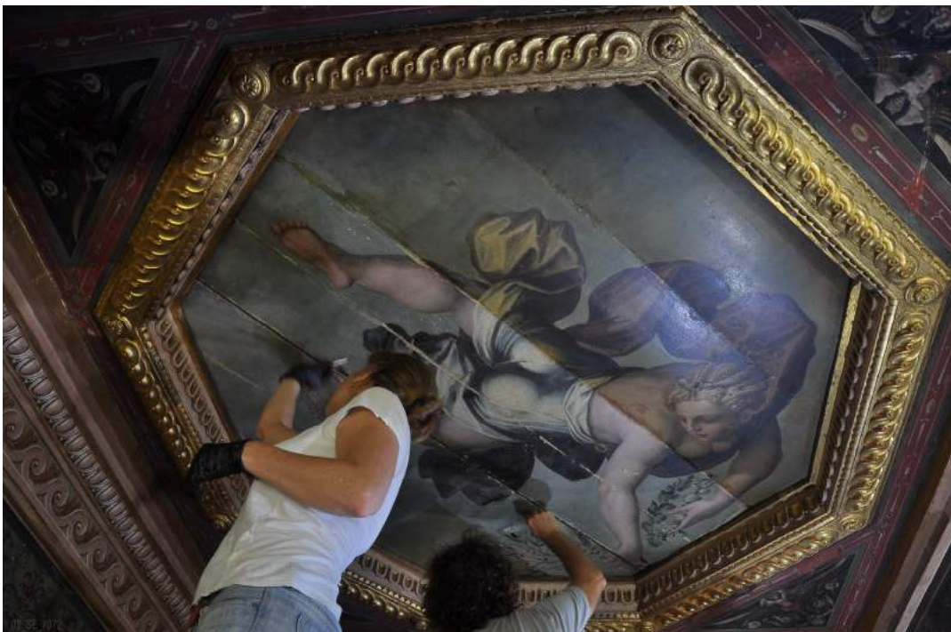
tavola rappresentante "la Pace" durante la pulitura