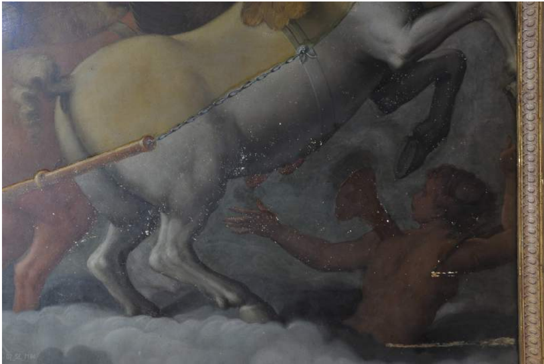
tavola rappresentante "il Carro del Sole" durante la pulitura