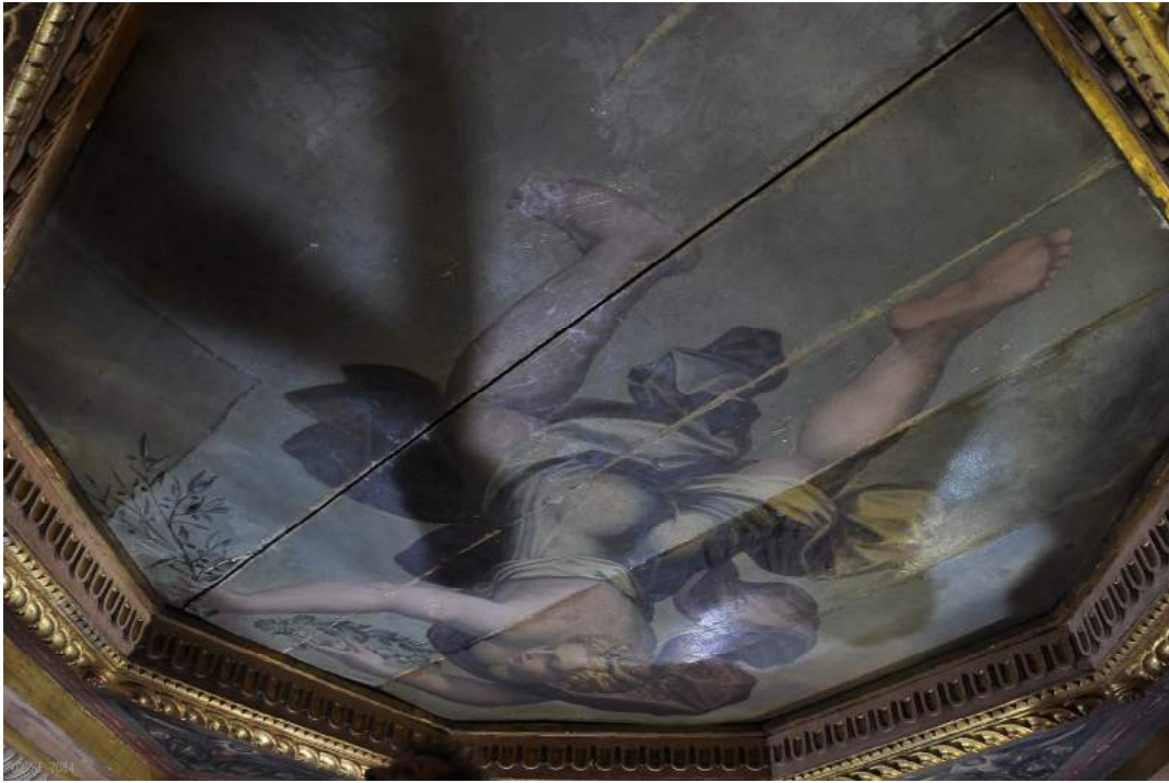
tavola rappresentante "la Pace" prima della pulitura

Seguono alcune foto rappresentanti le principali fasi del restauro che ha permesso di riportare in luce sia le tonalità cromatiche originali e sia i particolari nascosti dalle alterazioni delle vernici da cui si evince chiaramente la riequilibratura del soffitto alle tonalità cromatiche degli affreschi delle pareti circostanti.